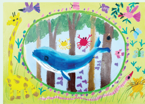
小记者 谈思蓓 绘