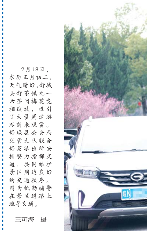
2月18日，农历正月初二，天气晴好，舒城县舒茶镇九一六茶园梅花竞相绽放，吸引了大量周边游客前来观赏。舒城县公安局交警大队联合舒茶派出所安派警力指挥交通，共同维护景区周边良好的交通秩序。图为执勤辅警在景区道路上疏导交通。