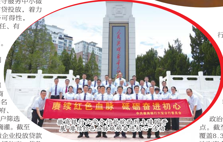
徽商银行六安分行赴皖西烈士陵园开展“赓续红色血脉 砥砺奋进初心”主题党日活动

浇灌文明志愿之花。徽商银行六安分行聚焦群众需求开展多元志愿服务，组织新就业群体亲子课堂、新春慰问及春运暖冬行动；学雷锋纪念日赴养老院关爱老人，高考期间常态化开展“爱心助考”活动，慰问留守儿童。同时，连续多年开展“慈善一日捐”及无偿献血，2025年捐款63600元、献血3400ml，践行奉献精神，弘扬新时代文明风尚。