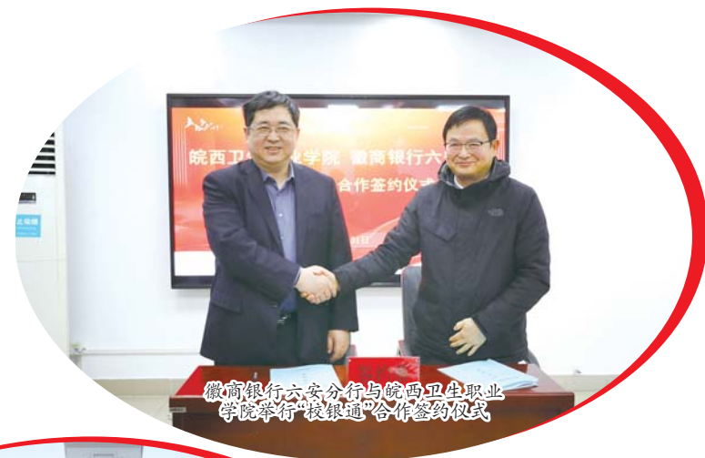
徽商银行六安分行与皖西卫生职业学院签订战略合作协议