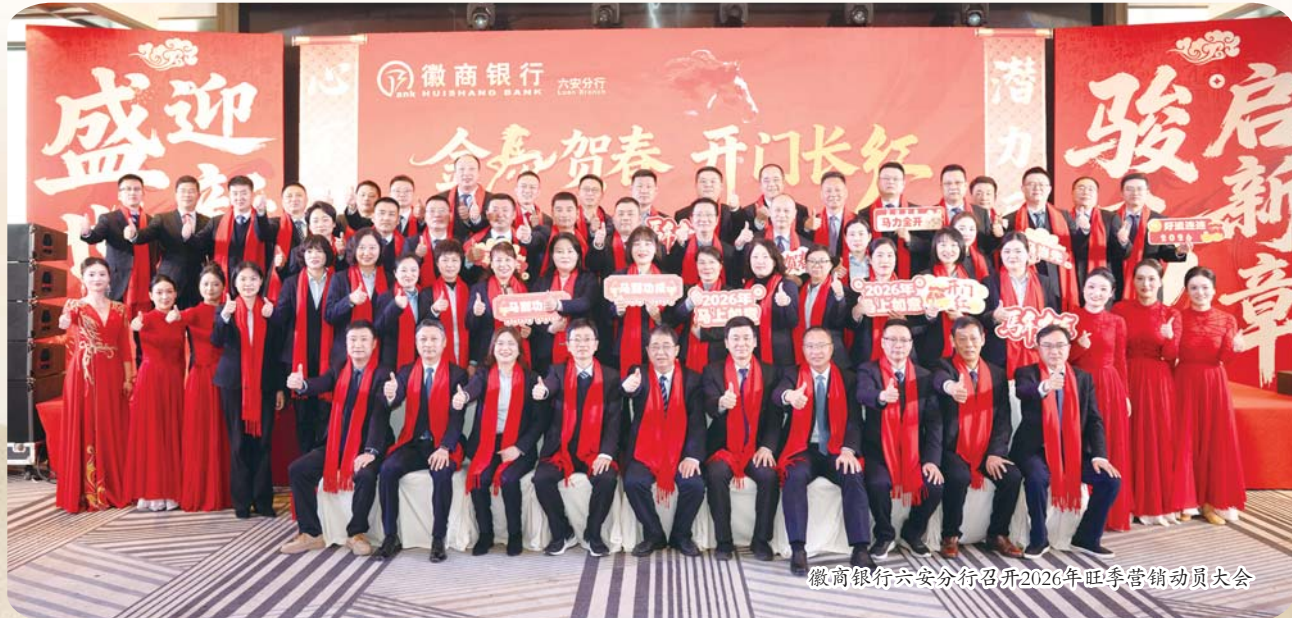
徽商银行六安分行召开2026年旺季营销动员大会

作为扎根本土的金融机构，徽商银行六安分行始终将社会责任融入经营发展血脉，在公益帮扶、反诈护航、志愿服务等领域持续发力，用实际行动诠释使命与担当，让文明之花在金融沃土绚烂绽放。