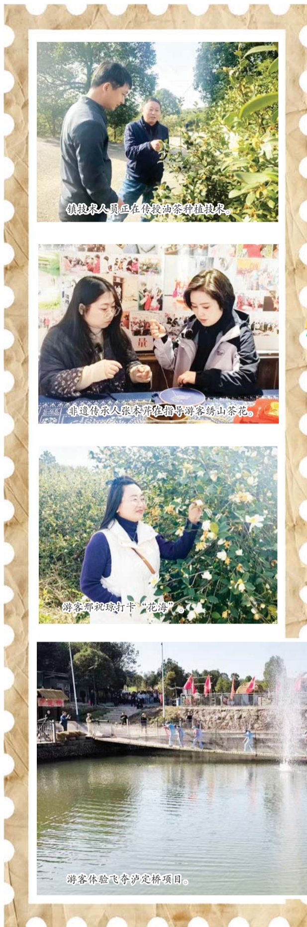
镇农人正在传授油茶种植技术。