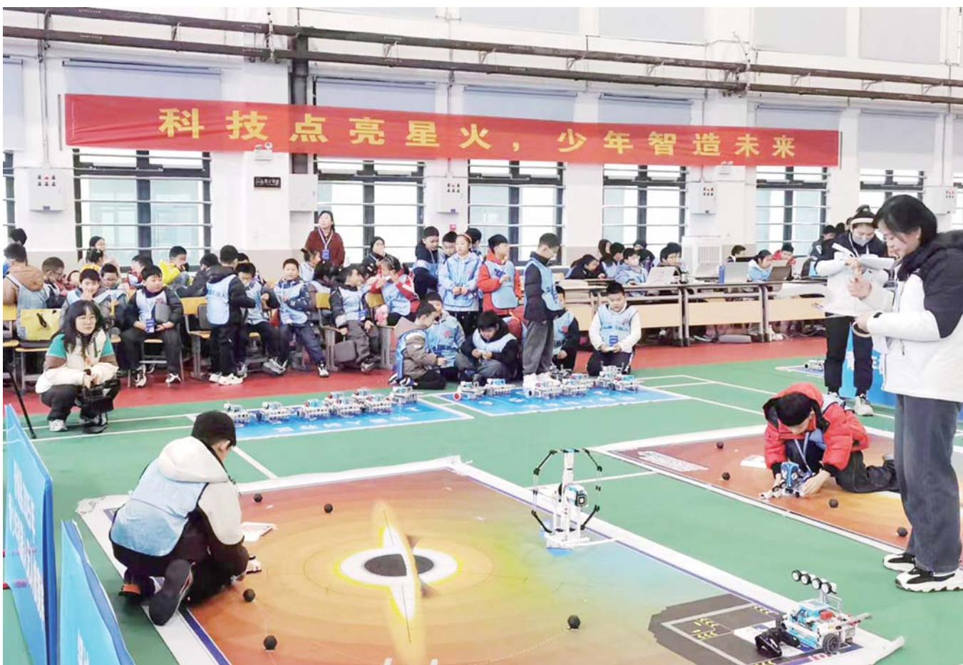
12月13日，舒城县2025年青少年机器人无人机竞赛在该县实验小学教育集团本部体育馆开赛，吸引全县20所中小学、幼儿园的258名选手同台竞技。

质量是工程建设的生命线。此次活动通过“看、比、评、促”的形式，为各村搭建了互学互鉴、比学赶超的有效平台，进一步激发了基层抓项目、提质量、促发展的内生动力。以此次观摩评比活动为契机，该乡要求各村主动对标先进、着力补齐短板，进一步压实责任，强化质量意识，在后续项目实施中严格把控规划、施工与验收等关键环节，并健全项目后期管护机制，确保项目持续发挥效益、助力乡村振兴。