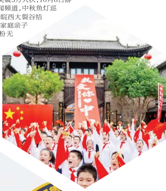
↑裕安区举行唱响《我爱你中国》。（资料图）