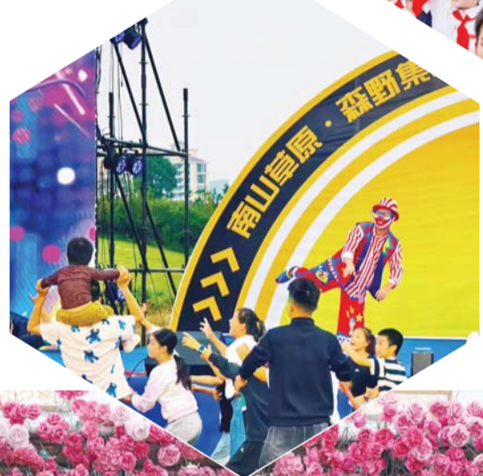
←游客乐享金安区南山草原音乐会。（资料图）