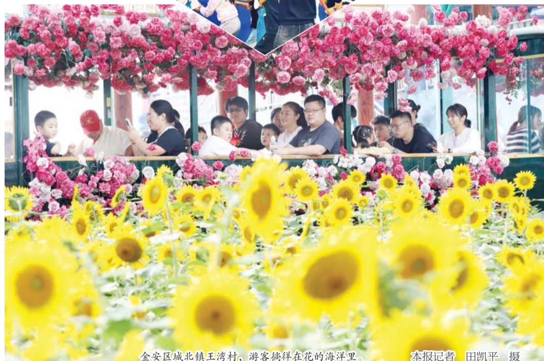
金安区城北镇王湾村，游客徜徉在花的海洋里。