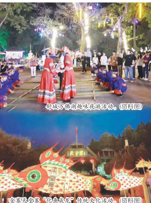
舒城万佛湖趣味夜游活动。（资料图）