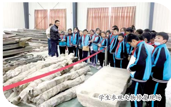
学生参观文物修复现场