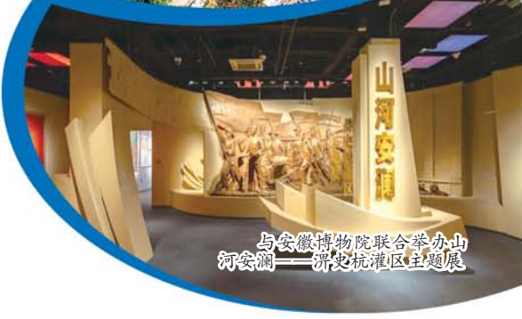
与安徽博物院联合举办山河安澜——新渡抗工程主题展