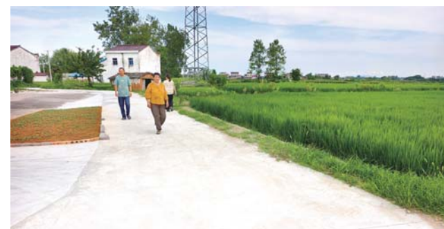
8月6日，新塘组村民走在家门口干净平坦的水泥路上。

“汪庄路，真神奇，晴天一身灰，雨天一身泥。”这首曾让金安区双河镇莲花村新塘组村民既无奈又心酸的顺口溜，如今在村里已悄然换了新词。