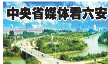
中央省媒体看六安

本报讯(记者 宋金涛)根据市气象局最新统计，8月9日午后我市出现降水，截至10日8时，全市平均累计降雨量36.1毫米，主要位于金寨大部、霍邱中南部、叶集、裕安西部和霍山西部，共9个站超100毫米，最大金寨县汤家汇158.3毫米。11日还有中等雷雨，部分地区大雨到暴雨；本轮强降雨过程持续时间长，累计雨量大，致灾风险高。根据《六安市防汛抗旱应急预案》规定，经会商研判，市防汛抗旱指挥部决定于8月9日16时启动防汛四级应急响应。 各地各有关部门要高度重视本轮强降雨防范应对工作，杜绝麻痹大意和松懈思想，各级防汛抗旱责任人要在岗在位、履职尽责。要严格落实“1311”防汛救灾应急响应体系，加强联合会商，滚动会商研判，加密监测预报预警，严格落实临灾预警“叫应”机制。要切实抓好山洪地质灾害防御，加强涉山涉水旅游景区、网红打卡点、施工营地、临崖临水道路、山洪灾害危险区、地质灾害隐患点、切坡建房等重点部位风险隐患排查整治，坚决落实“关停撤”措施。突出城乡内涝防范，在低洼易涝区、地下空间、桥隧等地前置排涝设备。要坚持人民至上，严格落实“四个一律”要求，果断提前转移危险区人员。要提前做好道路、供电、供水、通讯等应急抢险力量前置，保持卫星电话畅通，确保发生险情第一时间响应、第一时间处置。要严格执行24小时值班值守，突发险情第一时间上报。