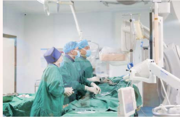
脑血管造影+急诊大脑中动脉取栓术