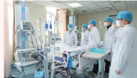
体外膜肺氧合(ECMO)技术