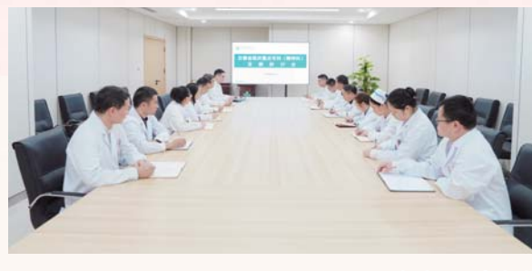
省级重点专科——精神科