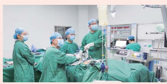
全腹腔镜胰十二指肠切除术

2024年5月20日,皖西卫生职业学院附属医院(六安市第二人民医院)迎来了历史性的一刻——成功晋级为三甲甲等综合医院。经过39年的艰苦奋斗,通过四年全过程创建,实现了从专科医院向集医疗、教学、科研、预防、保健、康复和急救于一体的现代化大型三甲甲等综合医院的跨越,并以雄厚的实力和厚德精医的境界,赢得了全市人民的广泛信赖。