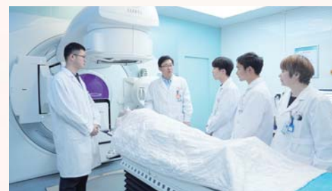
图像引导放疗技术(IGRT)