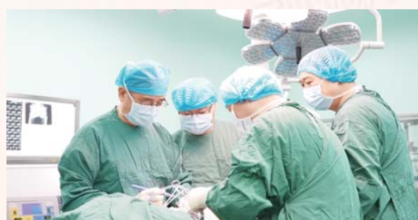
人工膝关节置换术