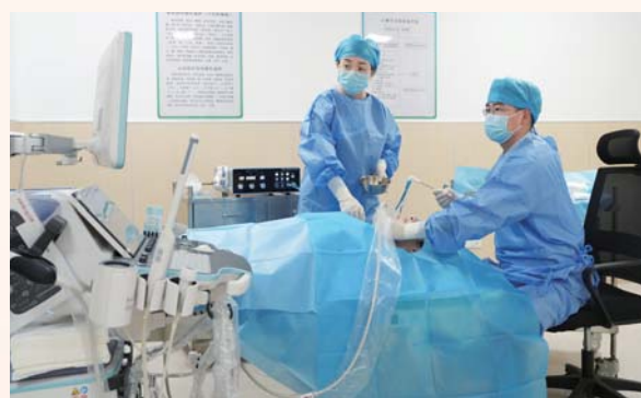
甲状腺腺微波消融术