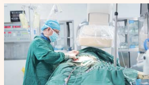
胸主动脉分支覆膜支架腔内隔绝术