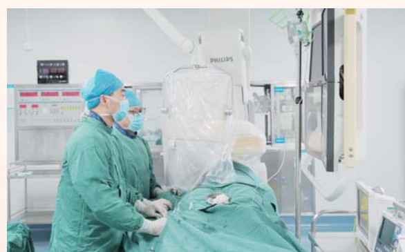
房颤射频消融+左心耳封堵一站式手术