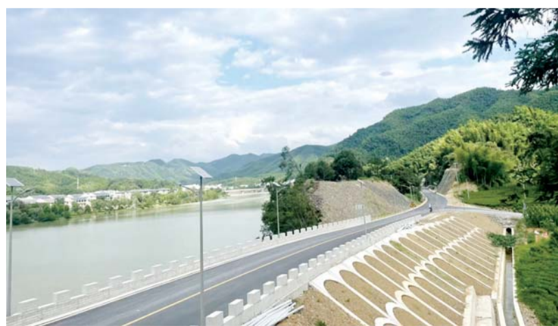
河西岸(黑佛路)沥青路,2023年6月建成通车,给黑石渡镇和佛子岭镇群众出行以及沿线企业运输带来极大便利。

每到雨季,汛期等特殊天气,与儿街镇大沙埂村的农村道路专员张万凤巡查时都格外认真,“发现塌方等路损路障