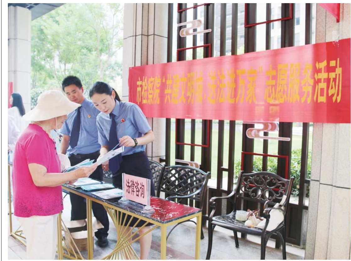
为深入开展“机关法律学习月”活动,积极营造尊法学法守法用法的良好氛围,8月17日,市检察院学雷锋志愿服务队到结对共建长安区徽盐龙湖湾小区,开展“共建文明城、送法进万家”法治宣传活动。

叶集区人大常委会审议认为,区检察院全面加强刑事司法监督工作,有力维护了刑事诉讼活动的程序和实体公正,并就如何进一步加强刑事司法监督工作提出了具体意见:一要切实提高政治站位。坚持“以人民为中心的发展思想”,把全面从严治检贯穿到刑事司法监督工作的始终,严守政治纪律和政治规矩,强化责任担当,加强刑事司法全过程监督,努力让人民群众在每一起司法案件中感受到公平正义。二要不断提升监督能力。强化检察队伍建设,持续推进检察队伍分层分类教育管理模式,不断优化队伍专业结构,培育专业型、专家型刑事司法监督业务骨干。全面落实司法责任制,将司法监督事项作为每案必查内容,确保监督无遗漏,扎实推进专项监督和类案监督相结合的监督模式,将多发的共同犯罪、关联犯罪案件如开设赌场犯罪、电信网络诈骗犯罪、涉黑涉恶犯罪等作为监督重点。三要持续提升监督质效。加强与执法司法机关的沟通协作,综合运用纠正违法意见、检察建议、再审检察建议、抗诉等不同监督方式,共同推动问题解决。深入推进司法责任制改革,健全司法监督专业化办案组织建设,促进检察监督与其他司法机关良性互动,不断提升司法办案质效。深化检务公开,自觉接受社会各界监督。