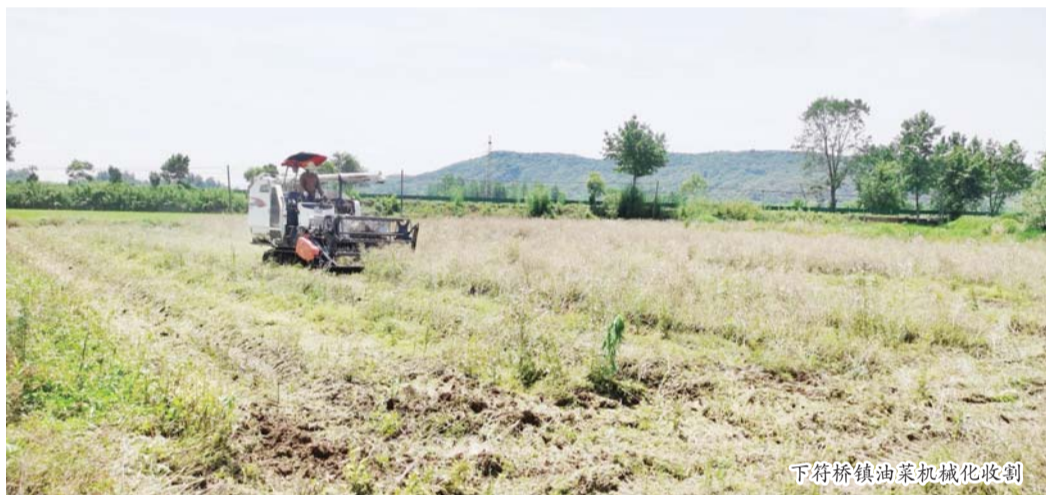
下符桥镇油菜机械化收割

“小满天逐热,温风沐麦圆。”“时雨及芒种,四野皆插秧。”入夏时节热浪翻,迎来收种大忙天。当前,正值油菜收割、耕田插秧的好时节,在霍山县的各个乡镇,收割机、犁耕地、插秧机来回穿梭,夏收夏种的乡村美景已徐徐展开。