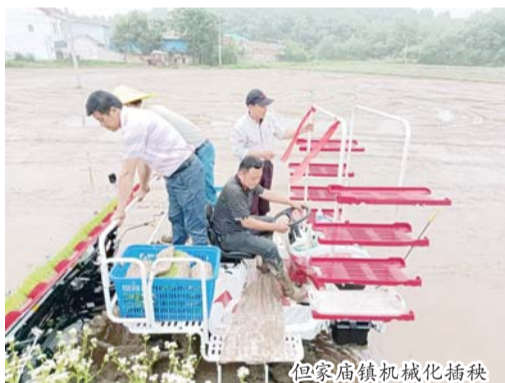
但家庙镇机械化插秧

近年来,霍山县大力推广应用各类农机装备,加快农业现代化进程,不断提升农业生产潜力和空间,降低群众种植成本,提高粮食产量,端牢手中饭碗,确保粮食安全。