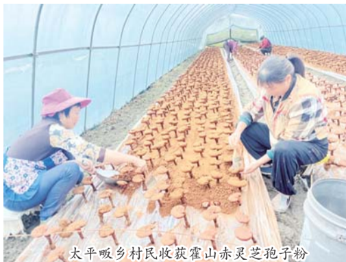
太平畈乡村民收获霍山赤灵芝孢子粉