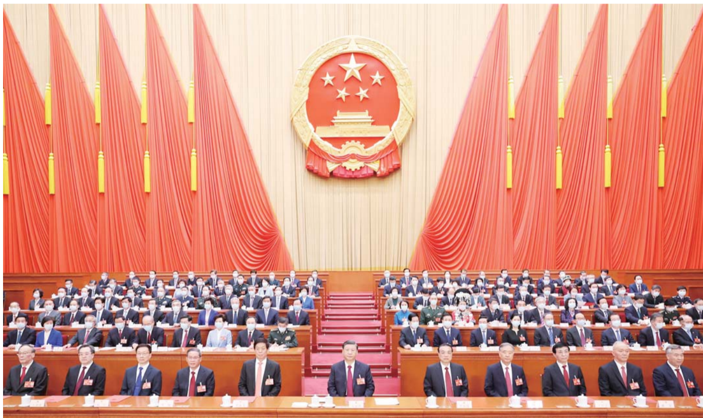
3月13日，第十四届全国人民代表大会第一次会议在北京人民大会堂闭幕。习近平等党和国家领导人在主席台就座。