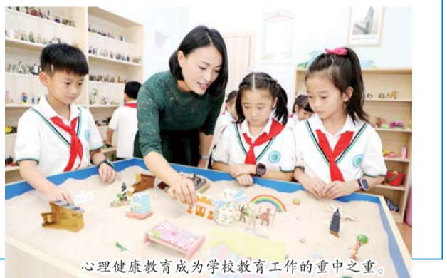
心理健康教育成为学校教育工作的重中之重。