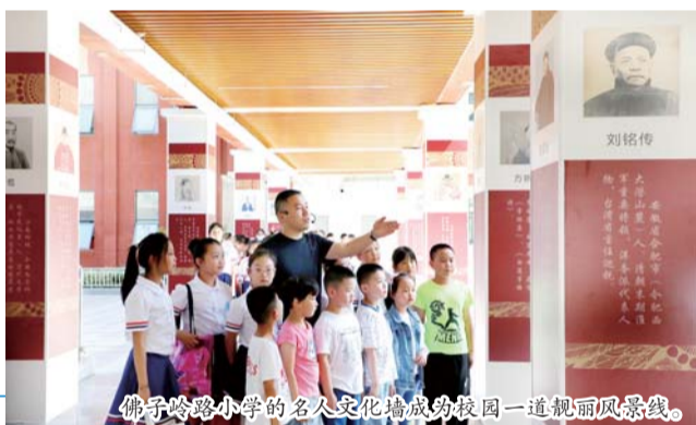
佛子岭路小学的名人文化墙成校园一道靓丽风景线。