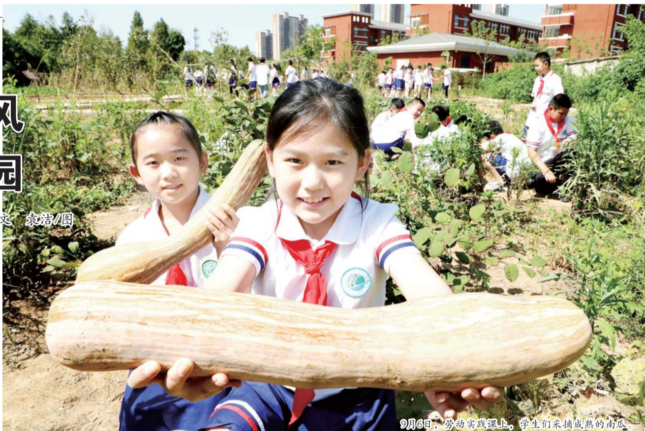
9月6日,劳动实践课上,学生们采摘成熟的南瓜。

全市教育系统把创建文明校园作为一项长远的、重要的、关键的工作来抓,扎实推进学校精神文明建设,努力提高学校整体办学水平和教育质量,为广大师生提供舒适文明的校园环境。各中小学校结合实际,开展文明校园创建活动,积极培育和践行社会主义核心价值观,充分展示学校精神文明创建成果。