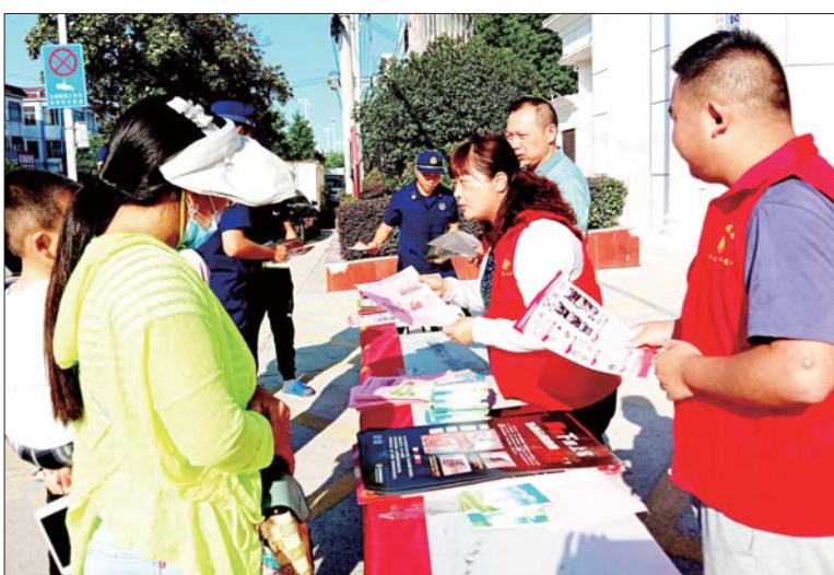
6月16日上午，叶集区姚李镇聚焦“遵守安全生产法，当好第一责任人”的活动主题，在府前街利用赶集机会，开展第21个安全生产月集中宣传活动。当天上午，姚李镇新时代文明实践所、安监所、市场监管所、消防中队、交通等多部门联合，通过设置咨询台、摆放宣传展板、悬挂宣传横幅、发放宣传手册等方式，向过往群众宣传安全生产法、交通安全、消防安全、森林防火、校园安全、“打非治违”、地质灾害等防灾减灾知识，同时为群众解答各类安全生产法律法规和日常安全知识技能问题，提升群众应对防范风险能力和安全意识。 程度厚 文/图