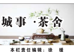
本栏责任编辑：徐 缓

这些所谓的规矩和禁忌，都是在当时经济生活水平、人们的思想认识水平、传统道德文化的影响等条件下综合形成的地方过年文化。有的不具有科学性、合理性，随着年味淡化、拜年形式的多样化，早已不复存在了，但其中敬重长辈，在新的一年里祝福福泽亲和自己，表达合理的希冀和美好愿望，带着这些美好大家一起出发，还是可以继承和发扬的。