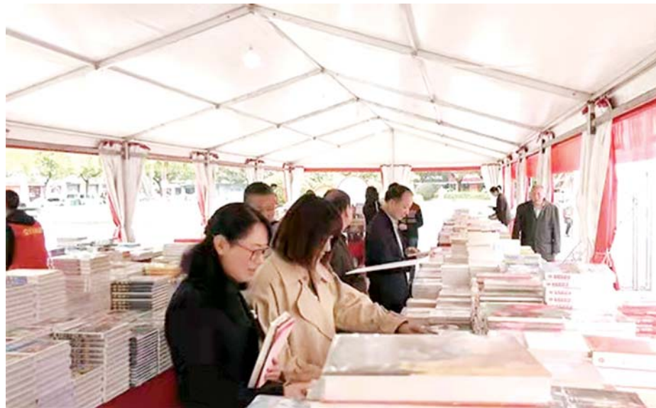
为在进一步兴起阅读热潮，营造良好的社会文化氛围，近日，霍山县举办了第四届“书香霍山·全民阅读”图书巡展文明实践活动，为西城中心学校和文峰小学分别捐赠了图书。在活动期间，市民家里有用过的课外书，也可以带到活动现场置换自己喜欢的书籍或者捐赠。(霍旅)

文化暖心，阅读惠民。本次活动旨在用书籍丰富山区群众和青少年的精神文化生活，开阔山区孩子的视野，关爱留守儿童的心灵，让更多有需要的人悦享书香，从而促进公共文化服务均等化、便利化。