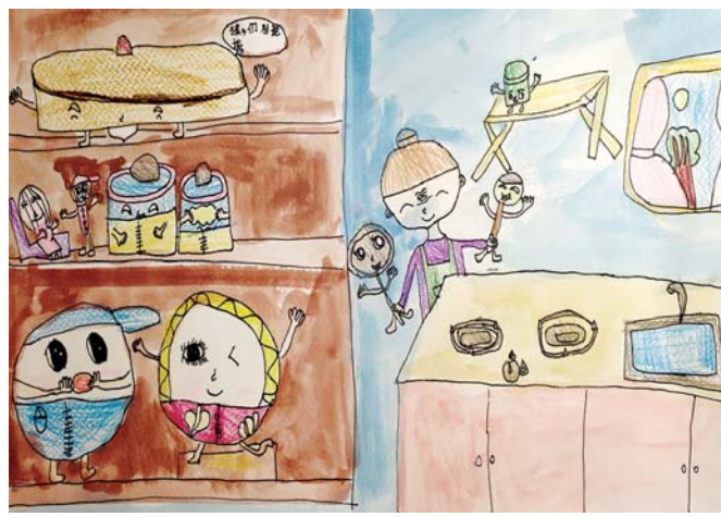
小记者 汪沐雨 作 指导老师 陈习敏