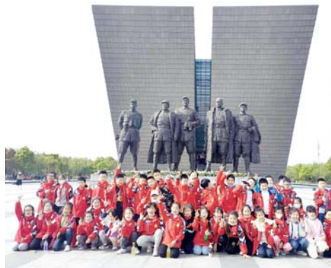
4月17日，六安城北第二小学小记者前往合肥青松集团、安徽名人馆和安徽渡江战役纪念馆进行为期一天的研学活动。

通过参与、体验、互动一体的立体式学习，了解食品安全、食品科普，通过现场体验，进行爱粮节粮教育，让小记者们边学边玩，增长知识、开阔视野，提高了小记者们社会责任感、创新精神和综合能力。