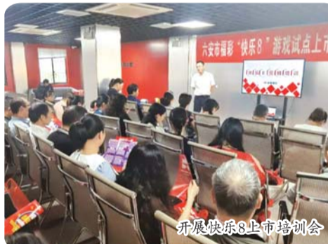
开展快乐8上市培训会

加大培训力度，强化营销技能。每年都邀请全国彩票研究专家、中彩注册认定的高级培训师、省福彩中心特约彩评师等开展“双色球”、“3D”为主的投注技巧培训和销售技能讲座，同时市中心积极培育自有省级内训师3名，通过“安徽福彩培训”微信小程序教育平台，组织全市投注站站长开展在线