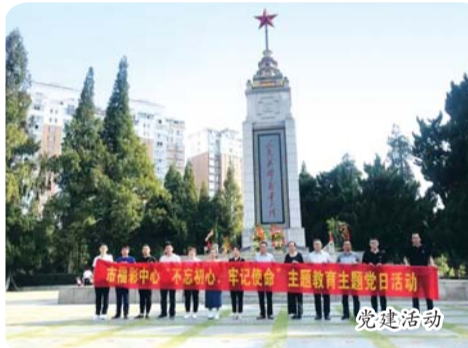
多措并举，巩固销售阵地

五年来，六安福彩中心以学习贯彻十九大精神为主线，推进基层党组织标准化建设为抓手，加强作风建设和反腐倡廉建设为重点，努力提高党员的政策理论素养，夯实党建基础，不断强化党员全心全意为彩民和投注站业主服务的宗旨意识，竭诚为站点排忧解难，为彩民释疑解惑，努力提高服务质量和水平。扎实开展“两学一做”主题教育活动，筑牢思想根基，践行初心使命。开展专题研讨、组织开展红色革命传统教育、支部扶贫结对、演讲比赛、开展志愿服务等系列活动，增强党员的使命感和责任担当，启迪激励员工的思想灵魂，稳定了福彩队伍，激发了系统上下的工作活力。五年来，市中心党支部坚持每月召开一次支委会、一次支部会、每季度上一次党课、每月组织一次党员活动。以福彩志愿服务队名义多次组织党员和职工积极开展志愿服务，开展“进社区、进企业、进农村、进家庭”志愿服务专项活动，开展创城入户宣传活动、交通文明劝导活动、组织市中心志愿者参与无偿献血活动；赴扶贫村走访慰问贫困户，同时给予资金支持等。特别是在新冠疫情和防汛抗洪期间，中心党员干部积极响应号召，深入一线值班、分发抗疫物品，成立福彩抗疫和救灾战线的先锋队，进一步增强了团队的凝聚力和向心力。