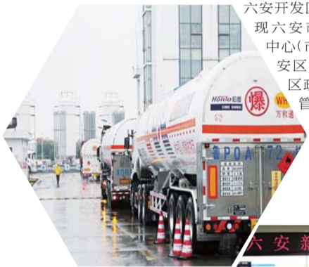
六安新奥智慧运营中心

2020年4月份,通过相关部门协调,六安新奥窗口进驻六安开发区政务大厅,实现六安市各行政服务中心(市政服务中心、金安区、裕安区、开发区政务中心、市城管公共服务中心)均可办理