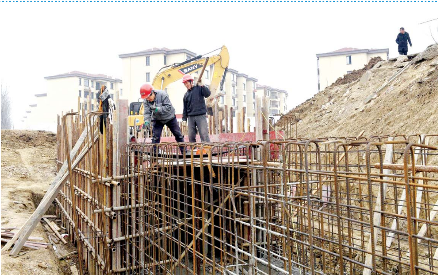
1月20日，城东湖蓄洪区裕安区固镇镇佛庵庄圩排涝项目工地上，施工人员正在绑扎箱涵。2020年7月，裕安区固镇镇遭受百年不遇的特大洪涝灾害，镇内13个村居近4万人受灾，部分道路、圩堤受损严重，其中农业基础设施直接经济损失达亿元。为了加快恢复基础设施功能，入冬以来，该镇科学规划，加大农田水利设施的建设力度，广泛进行圩堤除险加固、提水泵站更新改造，掀起水利冬修热潮，为来年农业增产提供良好的水利保障。