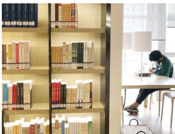
读者在馆内读书(资料图片)