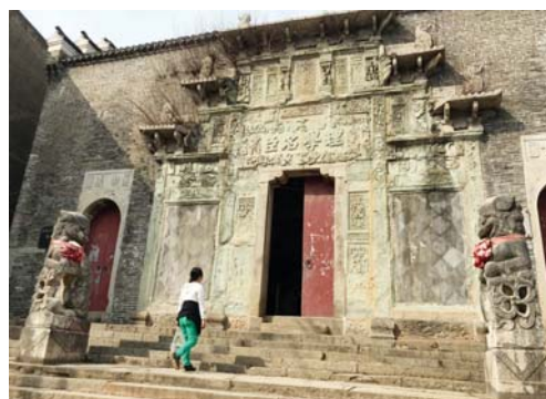
江西省九江市永修县吴城古镇“吉安会馆”遗址。

手艺人感到既熟悉又陌生。午餐时分，对面的饭馆飘来浓郁的美食香味，撩拨着游客的味蕾。费了很大功夫才找到一个小子坐下，却半天没有服务员来安排。原来由于食客太多，前厅后堂已经忙成一团，客人只有自己到厨房点菜，守在锅台边“抢菜抢饭”。野生的新鲜鳊鱼从150到200元，6至8条，硕大的土灶铁锅，一盆接一盆的烧，鱼香弥漫，令人垂涎。游客感慨道：品尝湖鲜还是到鄱阳湖来过瘾！冬日暖阳下，街坊邻居们聚在木质门面的小店里打牌消遣，神情自在安逸。而熙熙攘攘的游客，却打破了古镇老街的宁静。走进古树参天，环境清幽的镇政府，里面有2017年建成的“吴城镇历史文化展示馆”，而招待所也早已客满。一名当地人：“镇上正在打造旅游度假区，但工程尚未完成，所以观鸟季来临，住宿和餐饮接待都非常紧张。”徜徉在吴城古镇，脑海里闪现出一幕幕古代关于吴城的神秘故事片段，模糊而又真切。而装起相机，用手机边走边拍，画质虽不如单反，却能不干扰拍摄对象，更方便快捷地记录下小镇风情。在吉安会馆东边的街头，还有一大排青砖木柱的老宅，由于年久失修，少有居民，只见到一条刚油漆过的木船放在屋檐下，几只散养的大公鸡悠闲地踱步觅食。