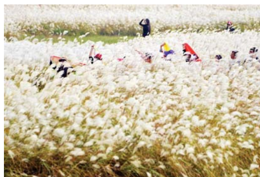
江西省九江市永修县大湖池湿地，游人徜徉在芦荻花海。