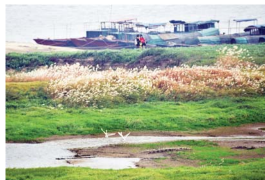
江西省九江市永修县修水河畔，芦花飞扬，白鹭起舞。

手艺，保持了几十年前的旧风貌，让人感到既熟悉又陌生。午餐时分，对面的饭馆飘来浓郁的美食香味，撩拨着游客的味蕾。费了很大功夫才找到一个小子坐下，却半天没有服务员来安排。原来由于食客太多，前厅后堂已经忙成一团，客人只有自己到厨房点菜，守在锅台边“抢菜抢饭”。野生的新鲜鳊鱼从150到200元，6至8条，硕大的土灶铁锅，一盆接一盆的烧，鱼香弥漫，令人垂涎。游客感慨道：品尝湖鲜还是到鄱阳湖来过瘾！冬日暖阳下，街坊邻居们聚在木质门面的小店里打牌消遣，神情自在安逸。而熙熙攘攘的游客，却打破了古镇老街的宁静。走进古树参天，环境清幽的镇政府，里面有2017年建成的“吴城镇历史文化展示馆”，而招待所也早已客满。一名当地人：“镇上正在打造旅游度假区，但工程尚未完成，所以观鸟季来临，住宿和餐饮接待都非常紧张。”徜徉在吴城古镇，脑海里闪现出一幕幕古代关于吴城的神秘故事片段，模糊而又真切。而装起相机，用手机边走边拍，画质虽不如单反，却能不干扰拍摄对象，更方便快捷地记录下小镇风情。在吉安会馆东边的街头，还有一大排青砖木柱的老宅，由于年久失修，少有居民，只见到一条刚油漆过的木船放在屋檐下，几只散养的大公鸡悠闲地踱步觅食。