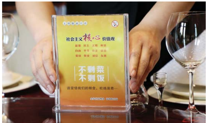
服务员在包厢内摆放宣传牌。