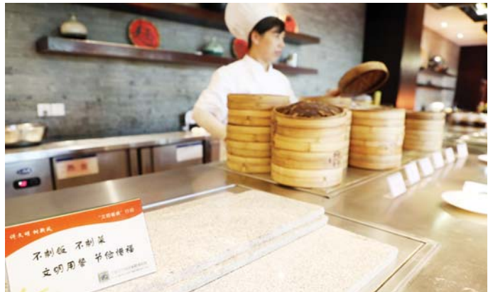
自助餐厅随处可见节约提醒语。

“我光盘、我光荣”、“不剩饭、不剩菜”“拒绝舌尖上的浪费”……9月11日，记者在金安区悠然蓝溪景区看到，在一些餐饮店里随处可见此类“光盘行动、文明用餐”的温馨提示。