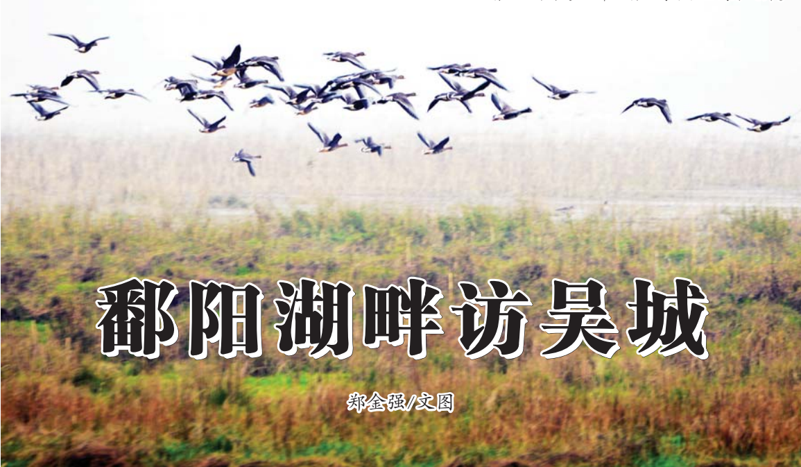
江西省九江市永修县都阳湖候鸟保护区鸿雁飞舞。