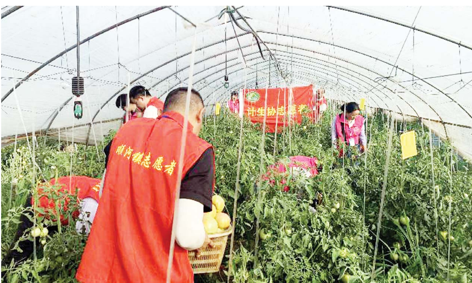
5月29日,是中国计生协成立40周年纪念日,也是计生协第22个“会员活动日”。当天下午,裕安区顺河镇计生协来到成员单位——安城村雨顺蔬菜种植专业合作社,帮助采摘喜获丰收的蔬菜。