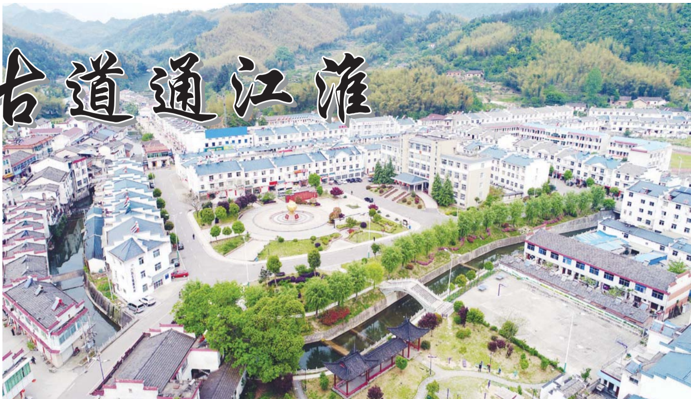
大化坪镇政府及金茗广场

记载：公元1129年，宋高宗率兵同金兵鏖战长岭。六安知军程端中引开金兵，高宗安然脱身，端中血战失其首而不伏地，金兵骇服。朝廷念其功节显著，赐金头合卺而厚葬。