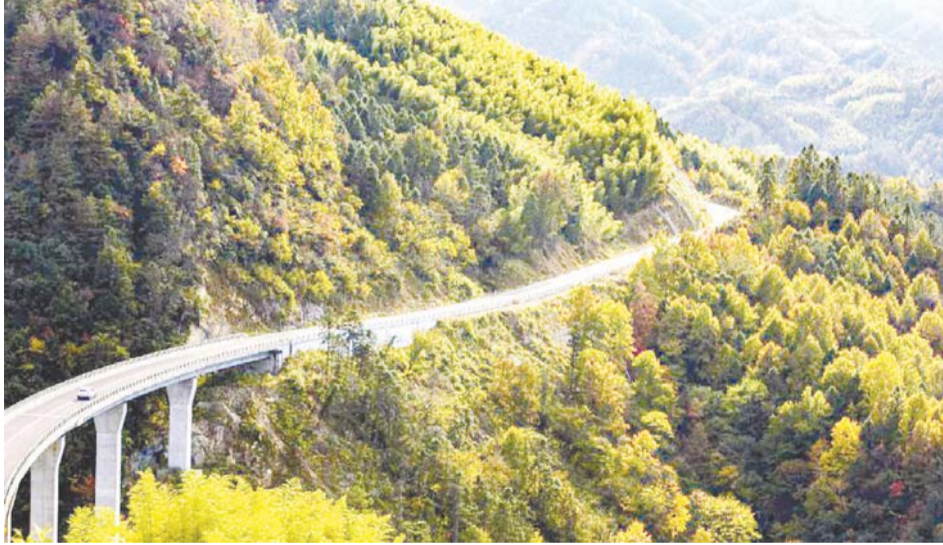
青枫岭段旅游扶贫快速通道