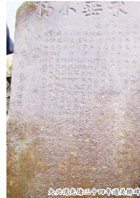
大兴湾光绪三十四年通关桥碑