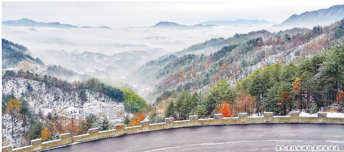
望九重段旅游扶贫快速通道