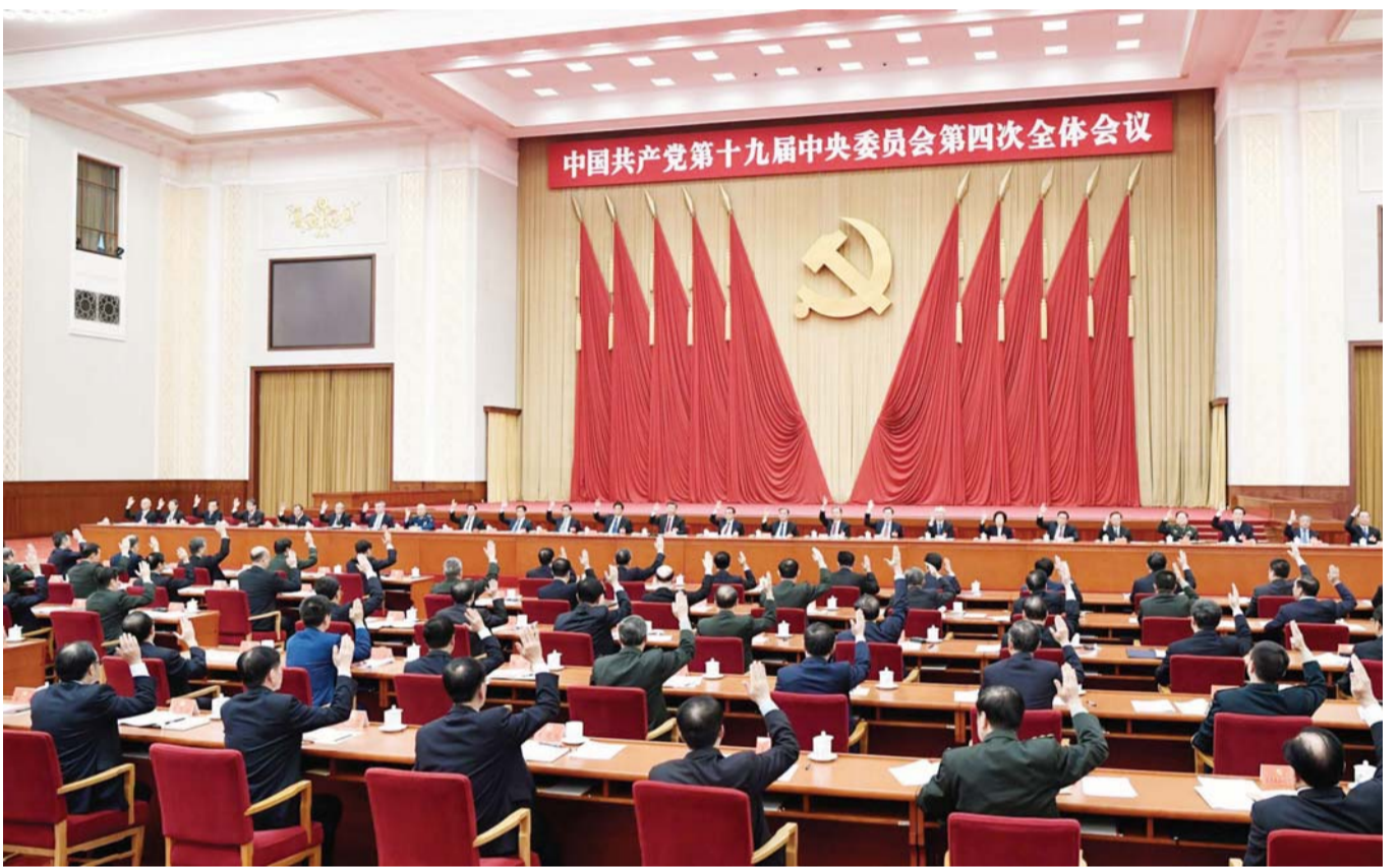
中国共产党第十九届中央委员会第四次全体会议,于2019年10月28日至31日在北京举行。中央政治局主持会议。