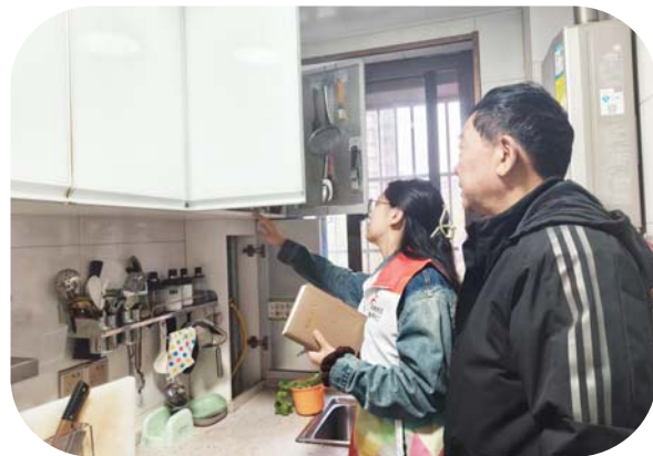
阳光社区工作人员通过“走动式”办公为居民排忧解难。