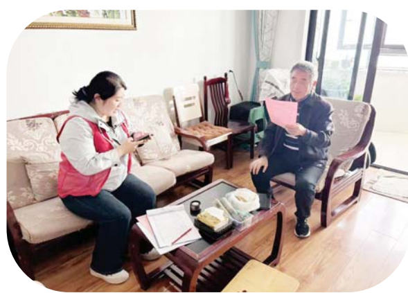
阳光社区工作人员在居民家中走访。